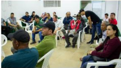
Brigadas de Escucha Rural Corregimiento Caimalito