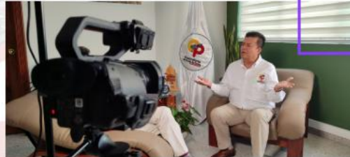
Contraloría en medios de comunicación