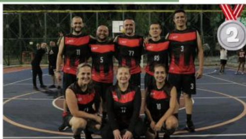
Plata en Voleibol Mixto