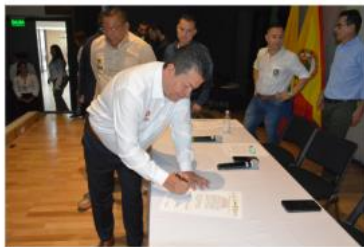
Alianza con Colectivos Ciudadanos