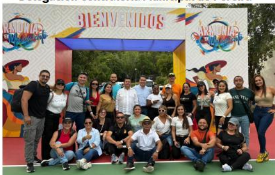
Delegación Contraloría Municipal de Pereira